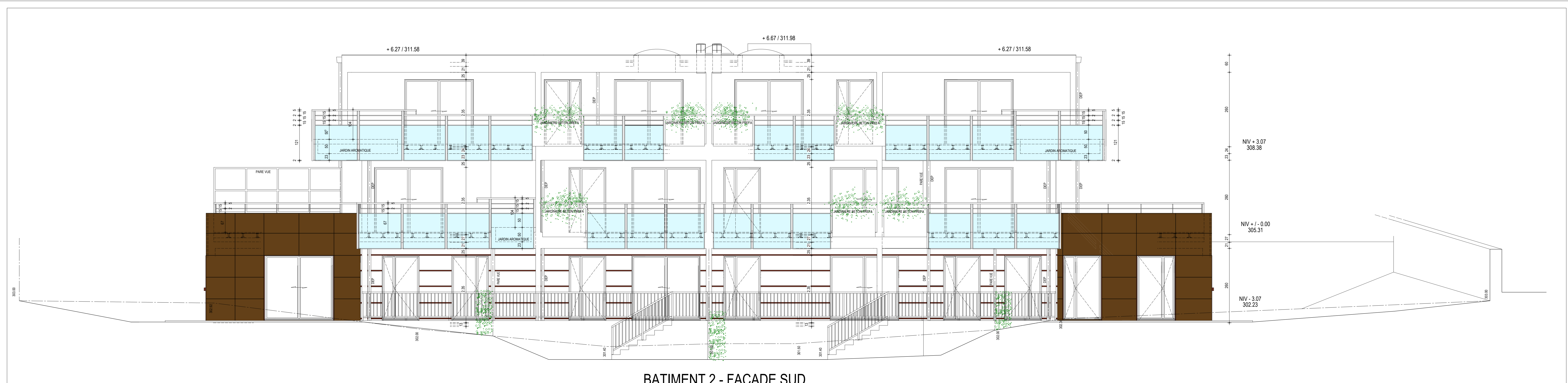
BATIMENT 2 - FACADE SUD